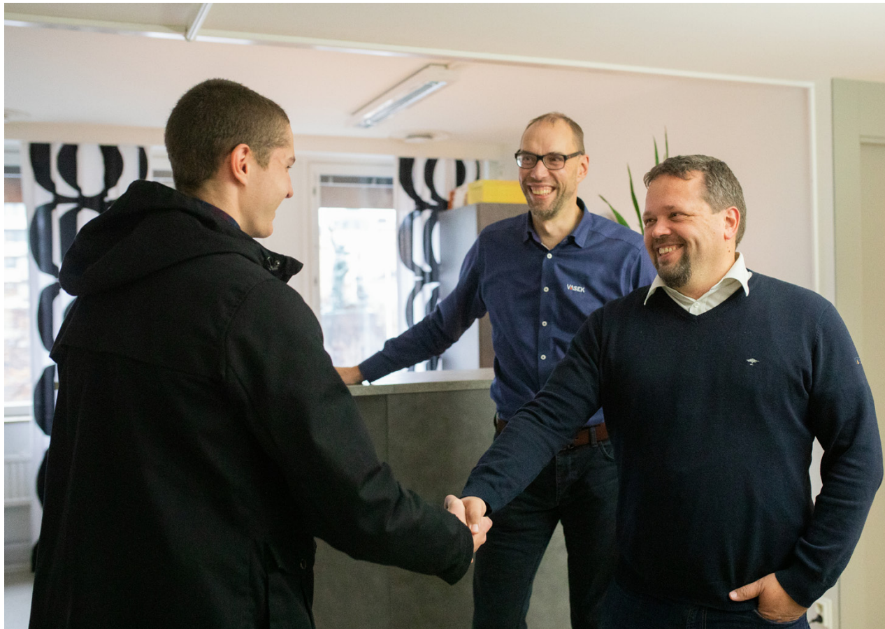
Både köpare och säljare behöver både omfattande material och personlig service under processen vid företagsköp.

–Minneslistan som kan användas till Due Diligence-granskning är avsedd för köparen, men säljaren kan också dra nytta av den och i en förhandsgranskning upptäcka brister vilka kan åtgärdas innan affären och sätta dokumenten i skick, konstaterar direktör för företagstjänster och ägarskift-