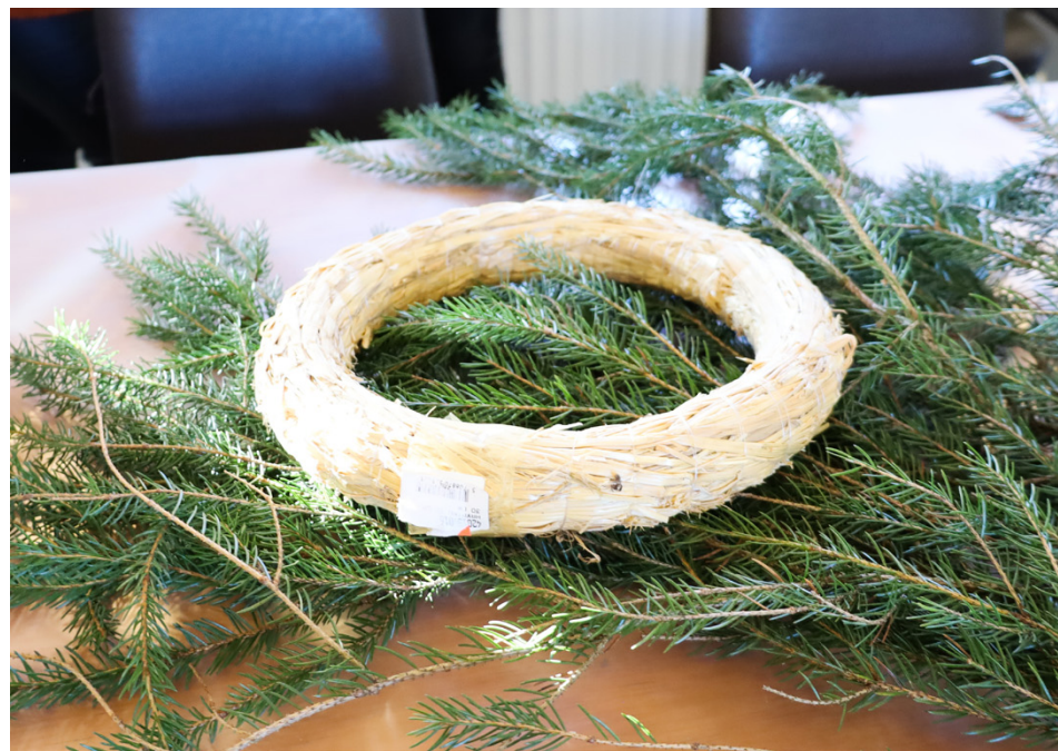
Har man en bra stomme kan vem som helst binda en julkrans.

VÖRÅ MEDBORGARINSTITUT VÖYRIN KANSALAIPOISTO